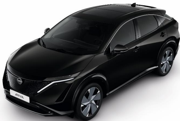
Czarny perłowy [GAT]