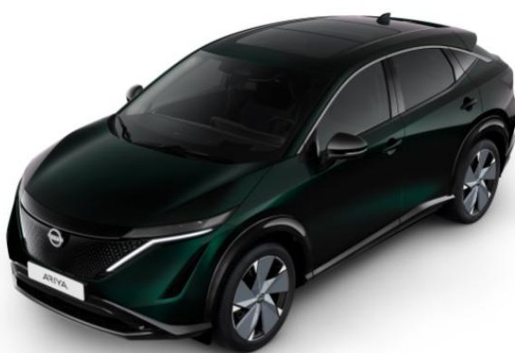
Zielony perłowy AURORA [DAP]