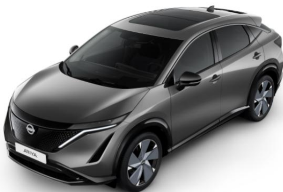
Szary metalizowany [KAD]