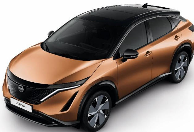
Miedziant Akatsuki + czarny dach i lusterka [XGJ]