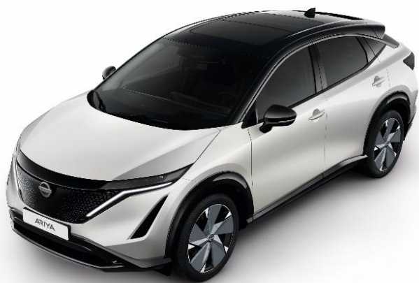
Biały perłowy + czarny dach i lusterka [XGA]

Lakier metalizowany / perłowy + dach i lusterka w kolorze czarnym – dopłata: 5 000 zł 1