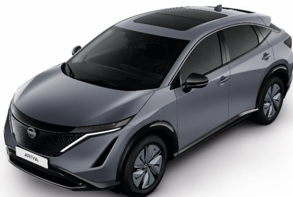
Szary ceramiczny [KBY]

Lakier metalizowany / perłowy (jednokolorowe nadwozie) – BEZ DOPEŁATY