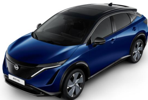
Niebieski perłowy + czarny dach i lusterka [XGU]