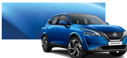
Niebieski - RCF