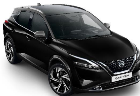
Czarny + Szary dach - XDK