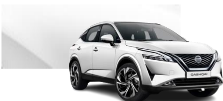
Biały perłowy - QAB