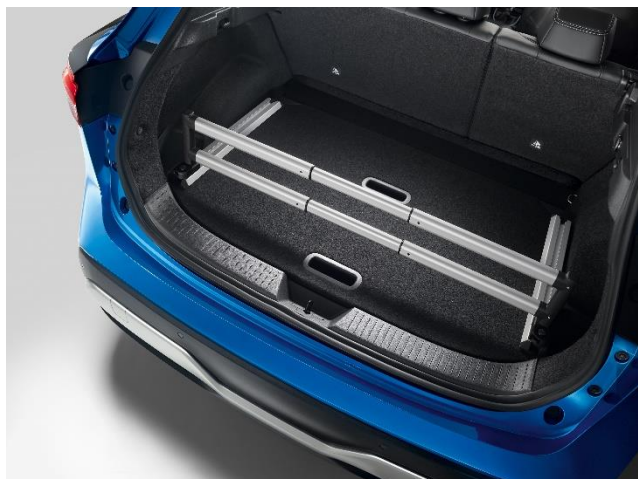
Rozdzielacz do bagażnika