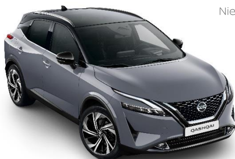
Szary ceramiczny + Czarny dach - XFU