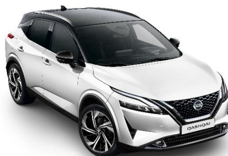
Biały perłowy + Czarny dach - XDF