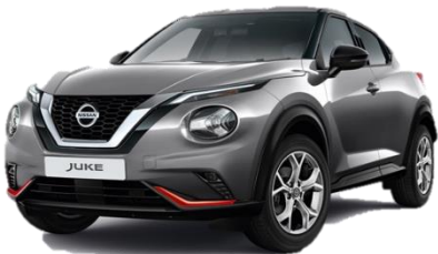
Miejski pakiet pomarańczowy