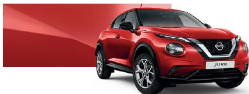
Czerwony - Z10