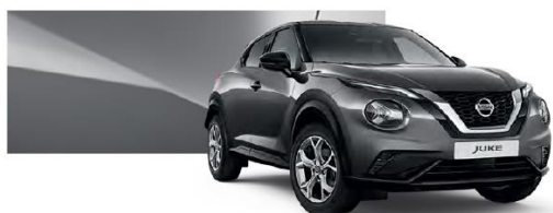
Szary - KAD

Lakier metalizowany / premium – 2.400 zł