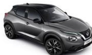
Szary + Czarny dach - XDJ Personalizacja wnętrza N-Design: W, B, R