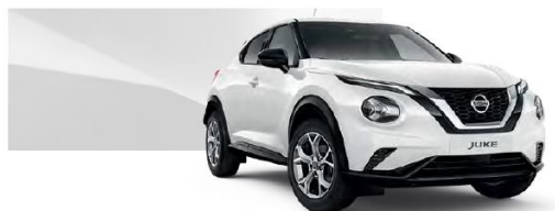
Biały - 326

Lakier metalizowany / premium – 2.400 zł