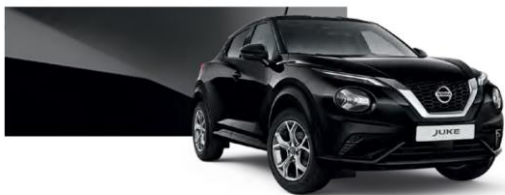
Czarny - Z11