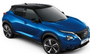
Niebieski + Czarny dach - XFV Personalizacja wnętrza N-Design: B