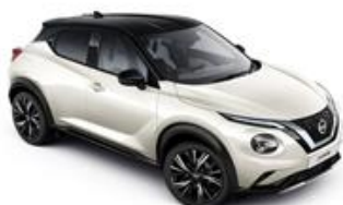
Biały perłowy + Czarny dach - XDF Personalizacja wnętrza N-Design: W, B