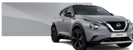
Szary ceramiczny - KBY