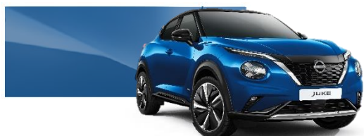
Niebieski - RCF