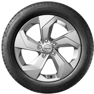
17" srebrna felga aluminiowa