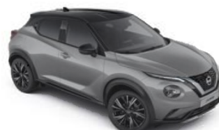
Szary ceramiczny + Czarny dach - XFU Personalizacja wnętrza N-Design: B

Dostępne 3 opcje personalizacji wnętrza dla wersji N-Design: