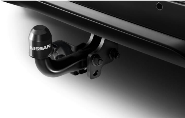
Hak holowniczy stały