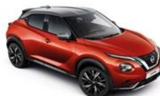
Czerwony Fuji Sunset + Srebrny dach - XEZ