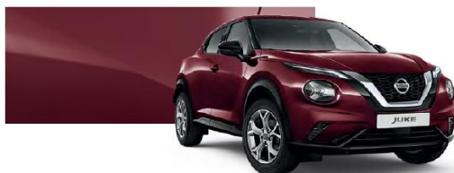
Burgundowy - NBQ