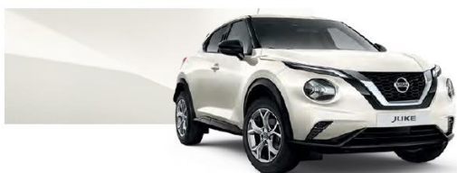
Biały perłowy - QAB