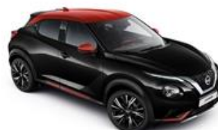
Czarny + Czerwony Fuji Sunset dach - XFC Personalizacja wnętrza N-Design: B, R