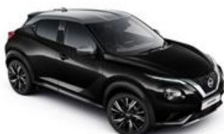
Czarny + Srebrny dach - XDZ Personalizacja wnętrza N-Design: B