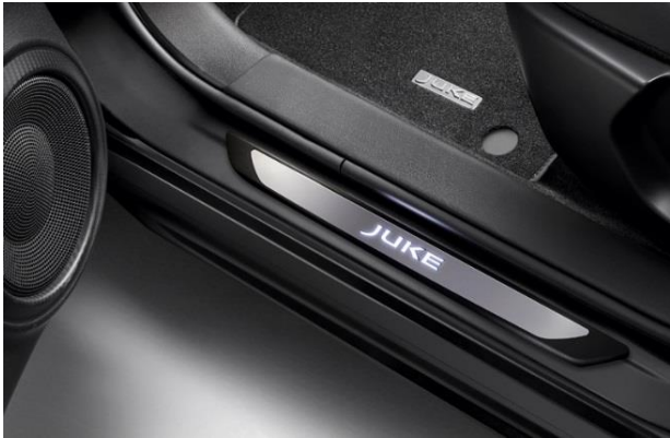
Podświetlane nakładki progów