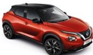
Czerwony Fuji Sunset + Czarny dach - XEY Personalizacja wnętrza N-Design: B