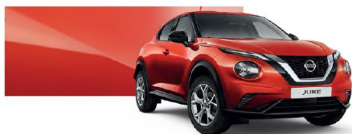
Czerwony Fuji Sunset - NBV