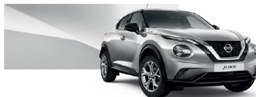
Srebrny - KYO