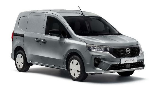
Szary Highland - KQA