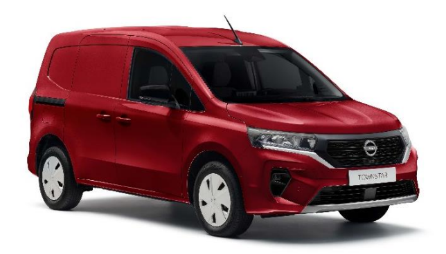
Czerwony Carmin - NPF