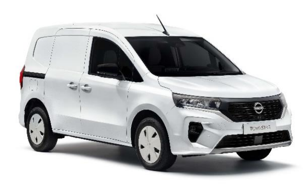
Biały - QNG

Lakier niemetalizowany - dopłata: 976 zł