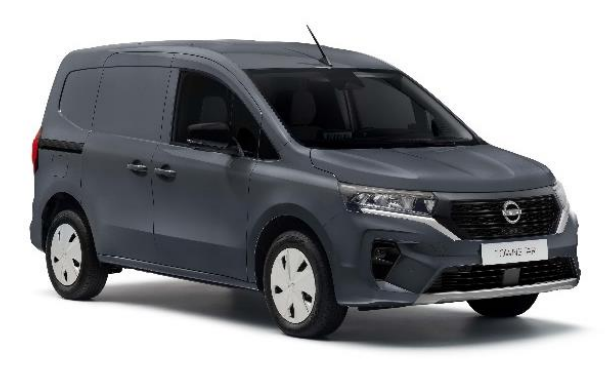
Ciemnoszary - KPW

Lakier niemetalizowany - dopłata: 976 zł