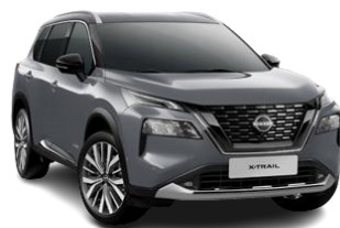
Ceramiczny szary – KBY