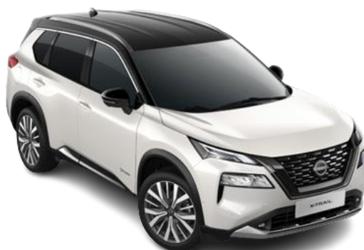
Biały perłowy + Czarny dach – XBJ