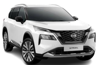
Biały – QAK