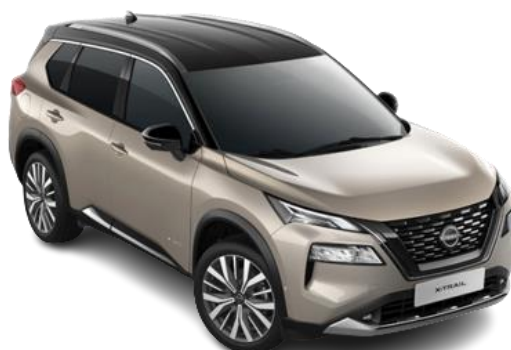
Szampański + Czarny dach – XEW