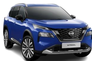
Niebieski – RBY