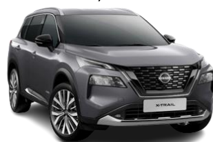
Szary – KAD