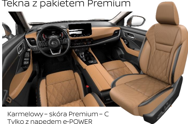
Karmelowy – skóra Premium – C Tylko z napędem e-POWER