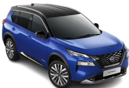
Niebieski + Czarny dach – XEU

Lakier dwukolorowy, perłowy / premium – 6.200 zł