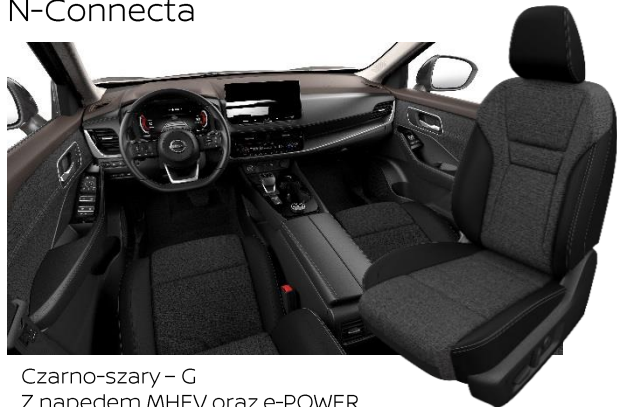
Czarno-szary – G Z napędem MHEV oraz e-POWER