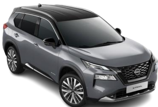
Szary ceramiczny + Czarny dach – XEX

Lakier dwukolorowy, perłowy / premium – 6.200 zł