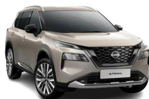
Szampański – KAY