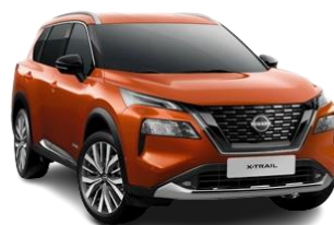
Pomarańczowy – EBL