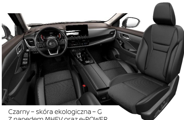
Czarny – skóra ekologiczna – G Z napędem MHEV oraz e-POWER