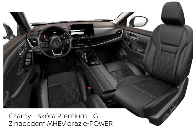
Czarny – skóra Premium – G Z napędem MHEV oraz e-POWER