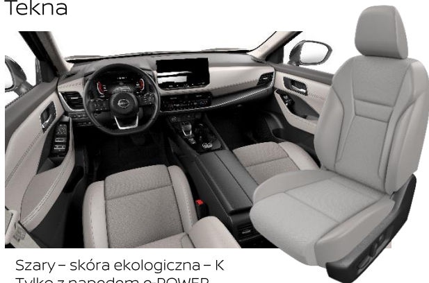
Szary – skóra ekologiczna – K Tylko z napędem e-POWER