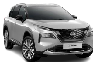
Srebrny – K23