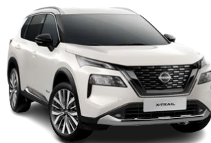
Biały perłowy – QAB