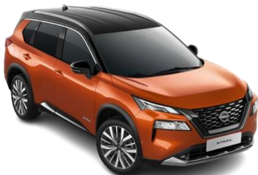
Pomarańczowy + Czarny dach – XEV

Lakier dwukolorowy, metalizowany – 5.900 zł