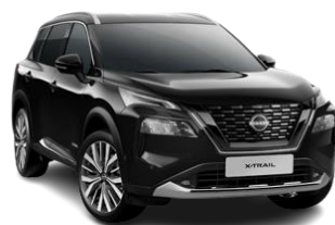
Czarny perłowy – G41