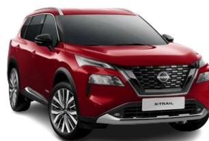
Czerwony – NBL